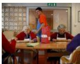
Primorske Novice 20.2.2019 poročajo o odprtju Demenci prijazne točke v Domu starejših občanov Ilirska Bistrica....